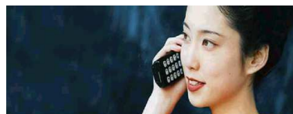
Téléphonie sans fils d'entreprise