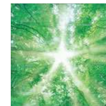
Opérateur Telecom et Internet