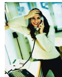
Prestation de services