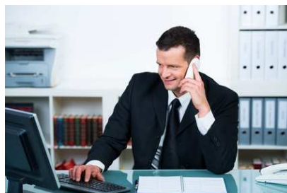
Installation Entretien et services