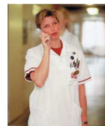
Appel malade et recherche de personne